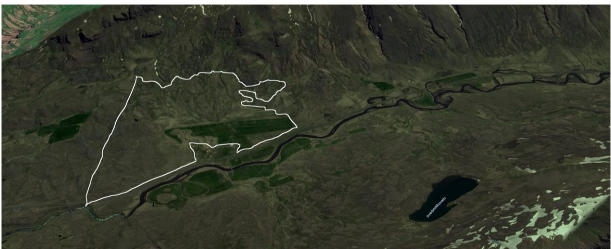
Mynd 3. Afmörkun skógræktarsvæðis við Engimýri (afmörkun ónákvæm).