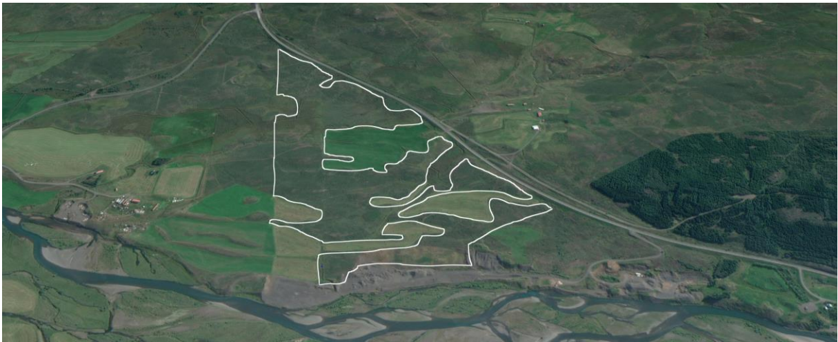
Mynd 2. Afmörkun skógræktarsvæðis við Grjótgarð (afmörkun ónákvæm).