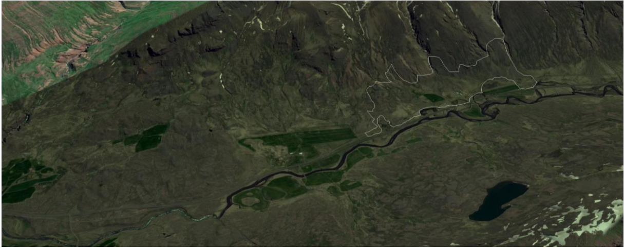
Mynd 1. Afmörkun skógræktarsvæðis við Geirhildargarða (afmörkun ónákvæm).