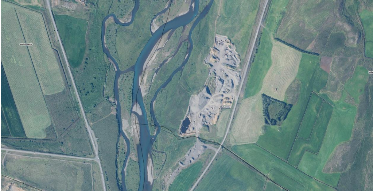
Mynd 4. Efnistökusvæði í landi Hlaða og Tréstaða.