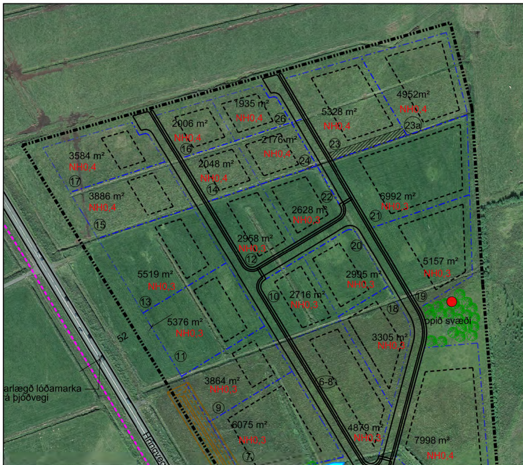
Tillaga að breytingu á deiliskipulagi Lækjarvalla, mkv. 1:2000