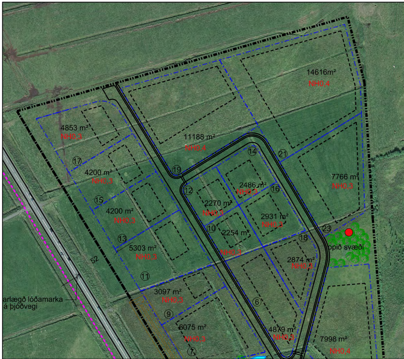
Gildandi deiliskipulag Lækjarvalla, m.s.br. Mkv. 1:2000