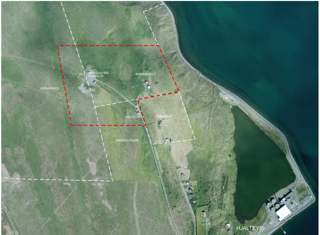
Mynd 1. Afmörkun skipulagssvæðisins (rauðar lína) og landamörk (hvítar línur).